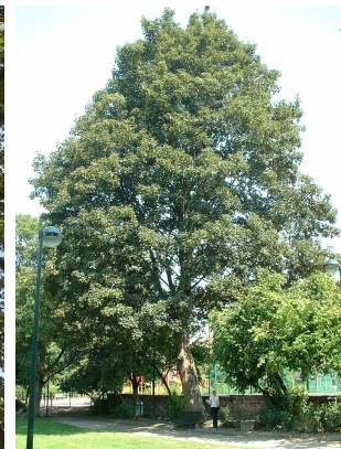
, 04 Août 2003